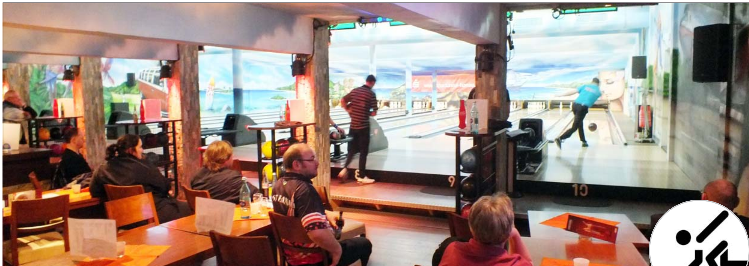
Die Zuschauer können das Geschehen auf den Bahnen entspannt verfolgen. Während eines Bowling-Spiels dürfen die Bahnen aber nur noch von den Akteuren betreten werden.